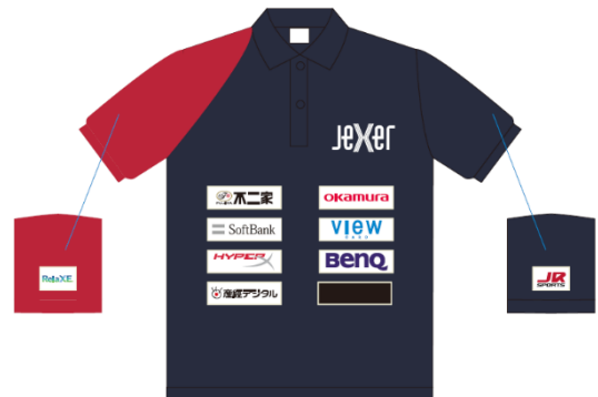
店舗スタッフユニフォーム