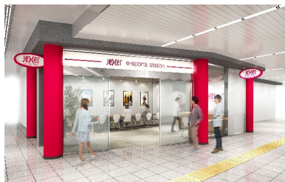
店舗外観(イメージ)