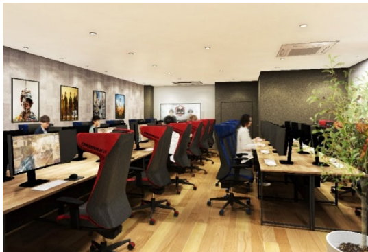
パソコンエリア内観