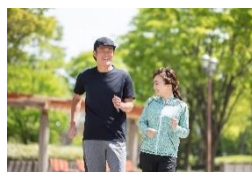
屋外で家族や友人と ウォーキング

エントリー方法やアプリ操作方法、プレゼント等のイベント詳細は6月15日（土）にジエクサー公式ウェブサイト最新情報やジエクサー各店館内掲示等にてお知らせいたします。